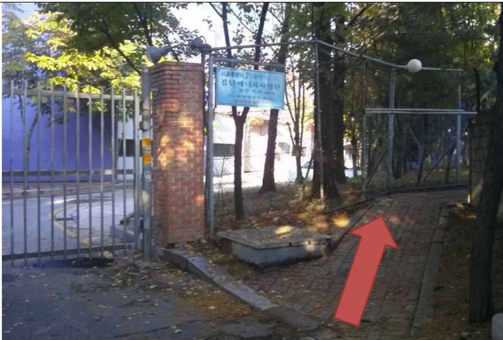
4. 화살표 방향 오솔길로 들어오시면 서울에너지공사 동부지사로 오실 수 있습니다.

※ 자가용으로는 들어올 수 있는 길이 없어 동부 간선도로 쪽 정문으로 들어오셔야 합니다.