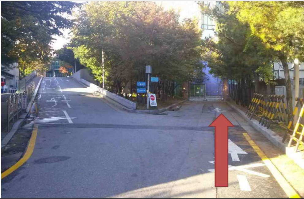
3. 우회전 하여 오르막길 옆 오른쪽 길(화살표 방향)로 갑니다.