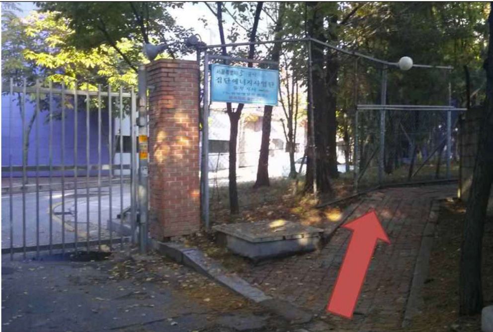
4. 화살표 방향 오솔길로 들어오시면 서울에너지공사 동부지사로 오실 수 있습니다.

※ 자가용으로는 들어올 수 있는 길이 없어 동부 간선도로 쪽 정문으로 들어오셔야 합니다.