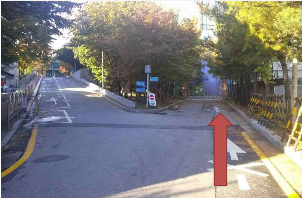
3. 우회전 하여 오르막길 옆 오른쪽 길(화살표 방향)로 갑니다.